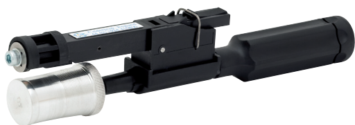
Ø 63 мм