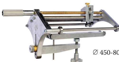
Ø 450-800 мм