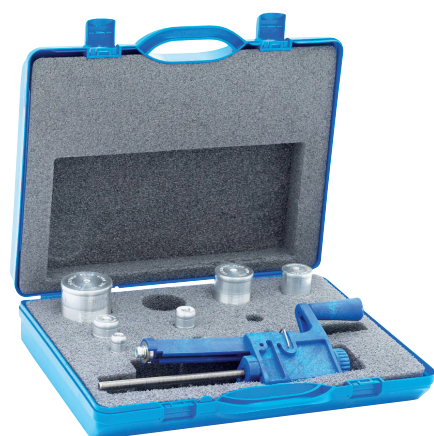
Универсальный набор Ø32-63 мм